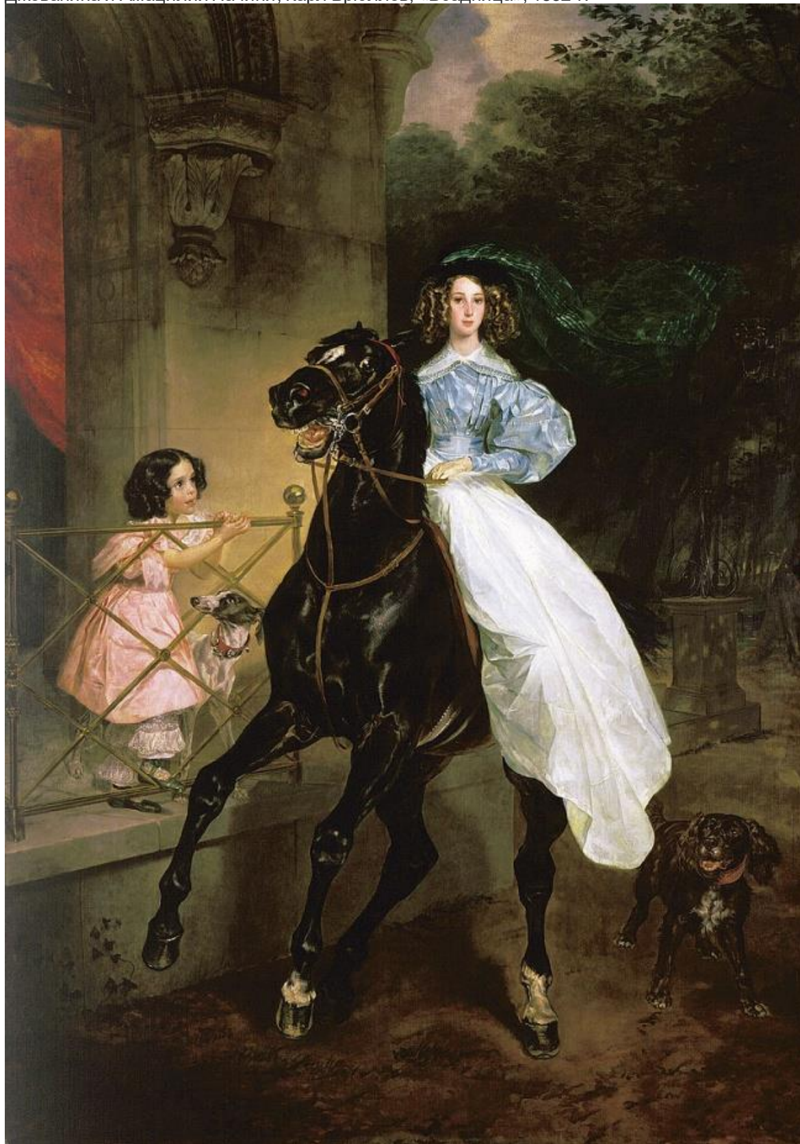
Джованина и Амацилия Пачини, Карл Брюллов, «Всадница», 1832 г.