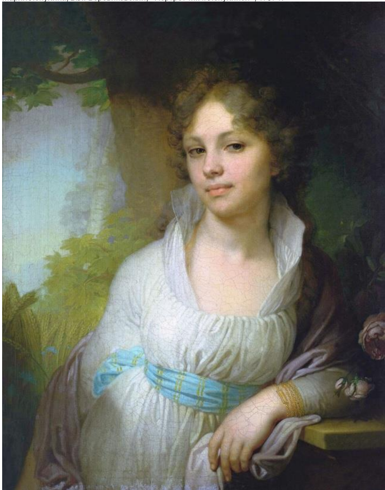
Боровиковский написал множество портретов русских