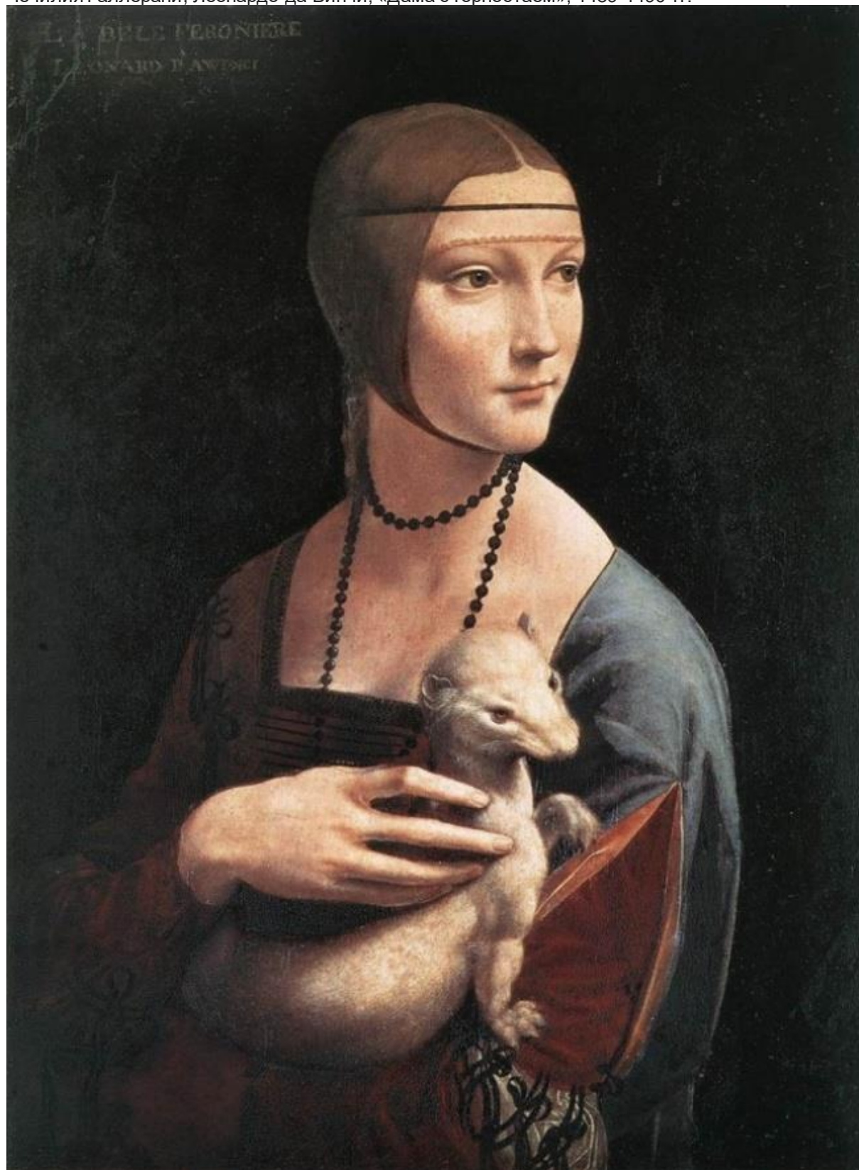
Чечилия Галлерани, Леонардо да Винчи, «Дама с горностаем», 1489-1490 гг.