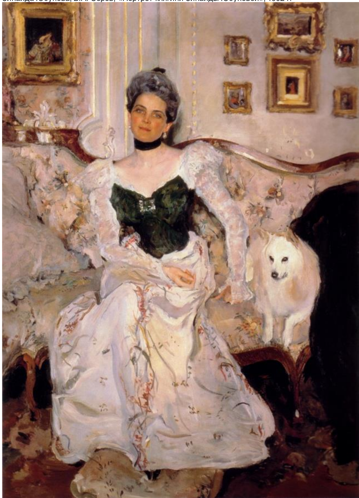
Зинаида Юсупова, В.А. Серов, «Портрет княгини Зинаиды Юсуповой», 1902 г.